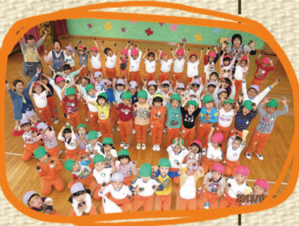
↑昨年、松ぼっくりとどんぐりを お届けした幼稚園のみなさんの 様子。とっても喜んでくれました!