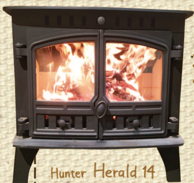
Hunter Herald 14