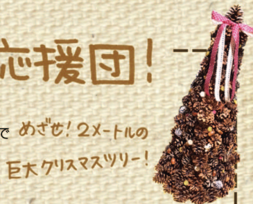
めざせ! 2メートルの 巨大クリスマスツリー!

昨年、福島県の幼稚園から松ぼっくりの販売はしていますか? と、お問い合わせがありました。震災のため、福島県ではこれまでのように、松ぼっくりを幼稚園の工作用として使えない、というお話を聞きました。そこで、子供達に安心して松ぼっくりやどんぐりで遊んでもらう為に、ボランティアで松ぼっくりを贈る活動を始めました。活動2年目を迎えた今年は、石川県の幼稚園なども松ぼっくり応援団に参加。今年12月には、福島県にみんなで大きな松ぼっくりのクリスマスツリーを作る計画も進行中です! 詳しくはHPにて!!