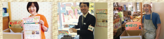
今年は松ぼっくり応援団 の仲間たちも増えて、 こんなにぎやか!